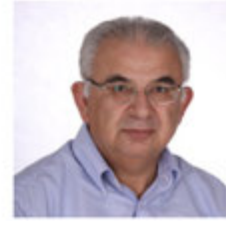
ΠΡΟΕΔΡΟΣ ΕΑΣ ΣΕΓΑΣ ΑΝΑΤ. ΜΑΚΕΔΟΝΙΑΣ ΚΑΙ ΘΡΑΚΗΣ

Η ΕΑΣ ΣΕΓΑΣ Αν. Μακεδονίας και Θράκης και όλα τα σωματεία της Ένωσης μας, καλωσορίζουν το RUN GREECE Αλεξανδρούπολης, το μαζικότερο αθλητικό γεγονός στην Β. Ελλάδα (εκτός Θεσσαλονίκης), με Πανελλήνιο και διεθνές χρώμα.